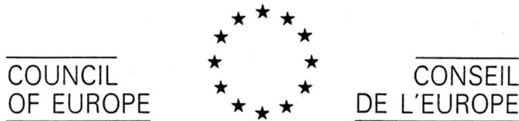
Europarådets emblem med 6ter nr QO189